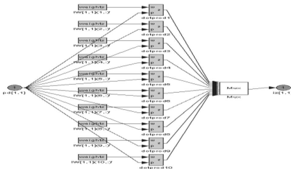
Рис. 1. Розгорнута схема блоку IW\{1,1\} для першого шару

На першому етапі досліджень була синтезована нейронна мережа типу «Feed - Forward backpropagation network», яка має два шари, що містять 10 і 1 нейронів відповідно. Для синтезованої НМЕ змінювалися ФА для дослідження точності ідентифікації. Структурні схеми шарів і блоків вагових коефіцієнтів для кожного шару показані на рисунках 1 та 2.