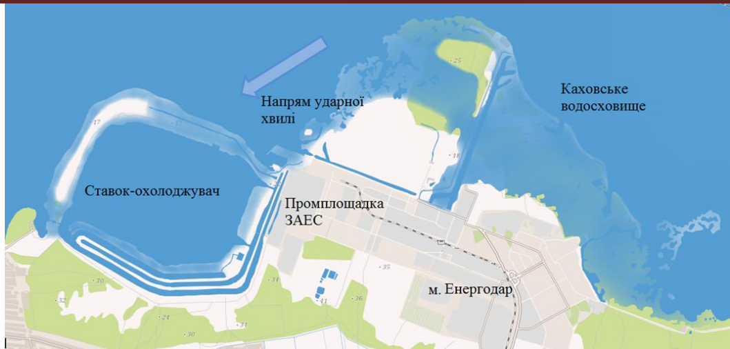
Рис. 1. Наслідки можливого затоплення промислового майданчика ЗАЕС

Досліджено, що ймовірність виникнення аварії внаслідок помилки персоналу АЕС складає 1,2 \cdot 10^{-4} рік -1 [2]. Частота помилок багато в чому визначається параметрами зовнішнього середовища, в якому людина працює. Проведено дослідження залежності кількості помилок оператора від впливу шуму та в повній тиші. Методами статистичної обробки експериментальних даних визначено поліномну залежність другого ступеню впливу шуму на якісні показники роботи обслуговуючого персоналу АЕС. Результати дослідження наведено на рис. 2.